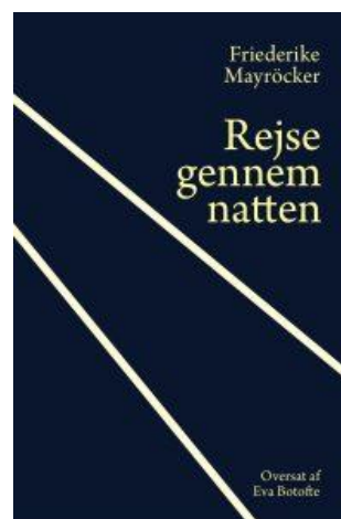
Friederike Mayröcker 'Rejsen gennem natten' Roman oversat af Eva Botofte Palomar