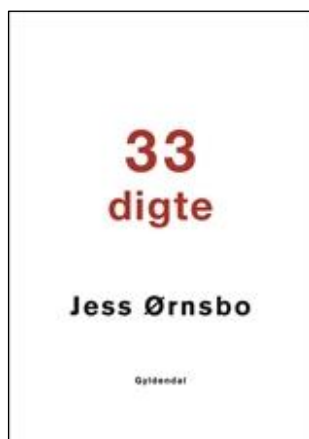
Jess Ørnbo 33 digte Digte Gyldendal