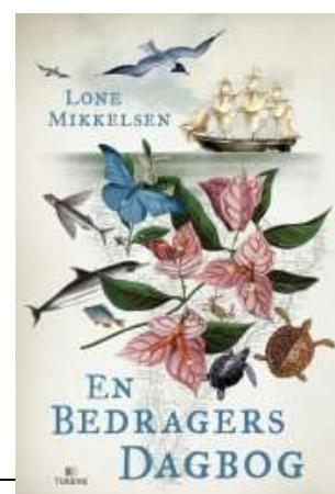
Lone Mikkelsen 'En bedragers dagbog' Roman Turbine