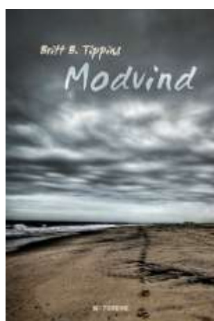
Britt B. Tippins 'Modvind' Roman Turbine