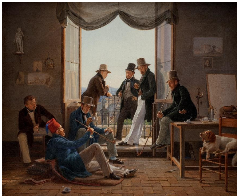
Constantin Hansen: 'Et selskab af danske kunstnere i Rom', 1837, SMK

Beløbet inkl. flyrejse tur/retur, enkeltværelse på hotel, udflugter, møder og foredrag. Hertil skal påregnes udgifter til måltider.