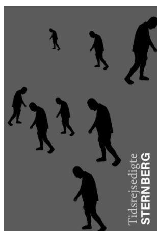
Sternberg 'Tidsrejsedigte' Digte Kronstork