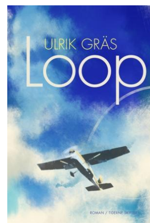
Ulri Gräs 'Loop' Roman Tiderne Skifter