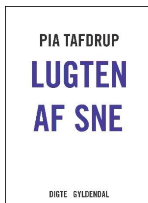
Pia Tafdrup 'Lugten af sne' Digte Gyldendal